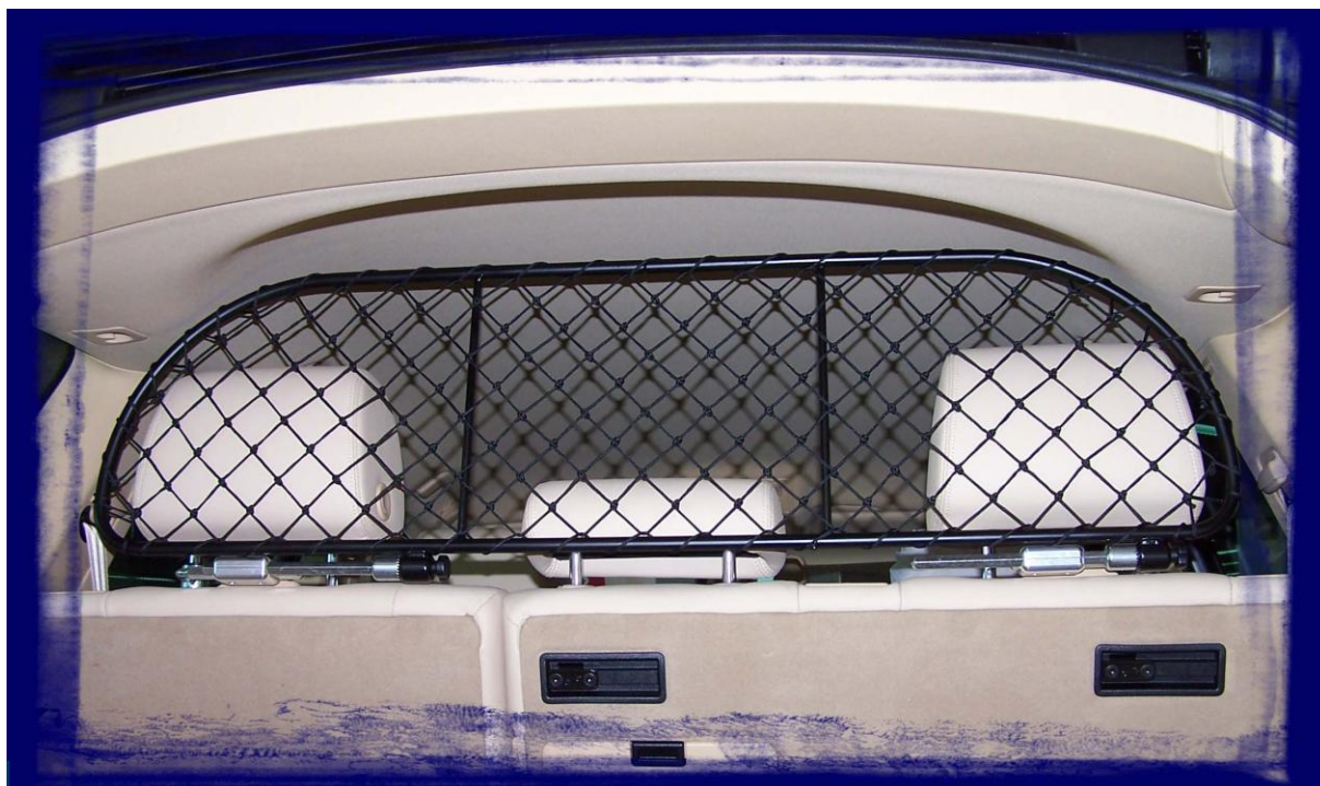
Reti per auto, griglie di separazione e divisori per auto per trasporto cani e fermabagagli, tasche per auto in rete e accessori per cani